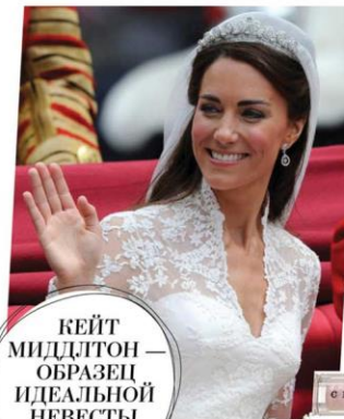
КЕЙТ МИДДЛТОН — ОБРАЗЕЦ ИДЕАЛЬНОЙ НЕВЕСТЫ XXI ВЕКА

Вместе с нашими экспертами мы разобрались в самых актуальных свадебных тенденциях весны и лета 2016 года.